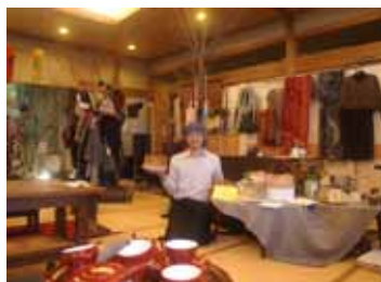
<第13回 道の駅かわはら>