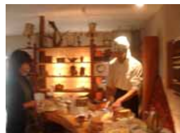
<第10回 ジュピタリアンヒル>