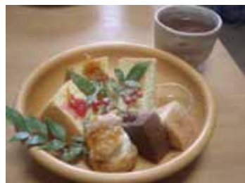
~ シフォンケーキ盛り合わせ ~

たくさんの方々に支えられ、“いちまいのおさら”からお客様のたくさんの笑顔を見ることができたことが何よりの喜びでした。2009年も各地で出店します。どうぞ期待あれ。