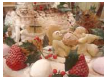
~ ハッピークリスマス ~