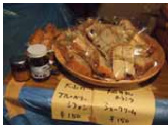
<第3回 クリエータズフォーラム>