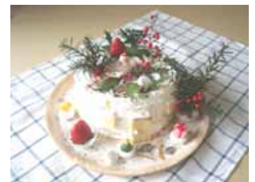
~クリスマスケーキ~

誕生日、記念日、クリスマスに。 依頼を頂ければ“いちまいのおさら”にスイーツをオーダーメイドいたします。