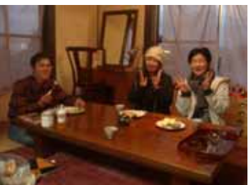
<番外編 Moga のお茶会>

今年から本格的に始まった OneDayCafe では、鳥取市・琴浦町・大山町・米子市・境港市の、雑貨屋さん・弓ヶ浜・友人宅・牧場・本屋さん・鍵掛峠など実に様々な場所で開催させてもらいました。