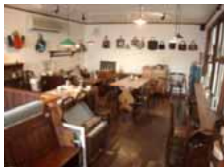
<第1回 Cafeweek in BRUN>