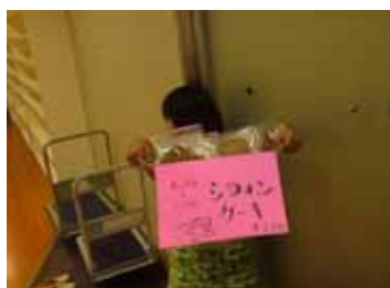
<第5回 ど真ん中フェスタ>