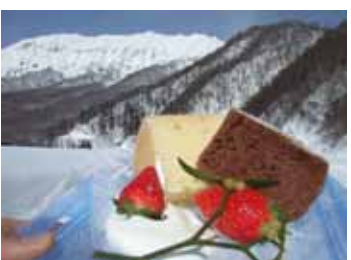
<番外編 真冬の鍵掛峠>