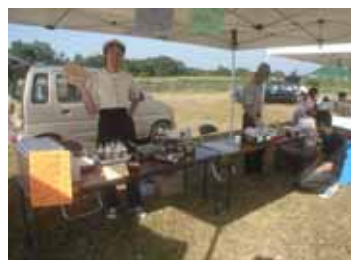
<第8回 平澤牧場収穫祭>