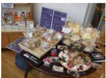
<第16回クリエイターズマーケット>